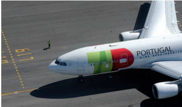
Conexão Curitiba-Lisboa: Paraná terá voo para a Europa a partir de 2026

Serão utilizadas aeronaves Airbus A330-200, com capa-