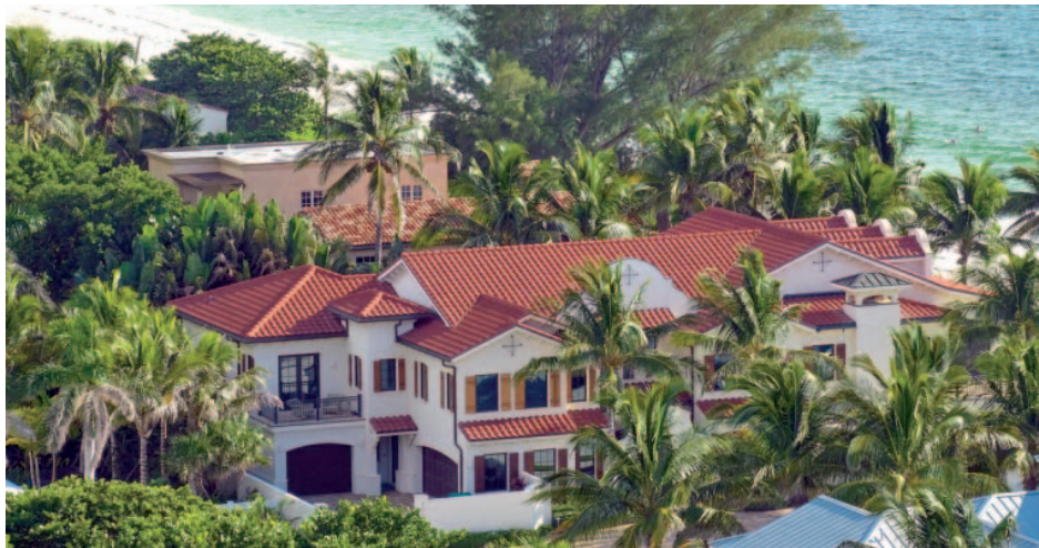
"Não mansões suficientes", exclama especialista

A Califórnia não fica muito atrás, claro. Los Angeles continua a ser um peso pesado neste espaço, com quatro dos 10 principais negócios a serem efetuados em LA, incluindo uma propriedade em Bel-Air no valor de 110 milhões de dólares , mais de meio bilhão de reais.