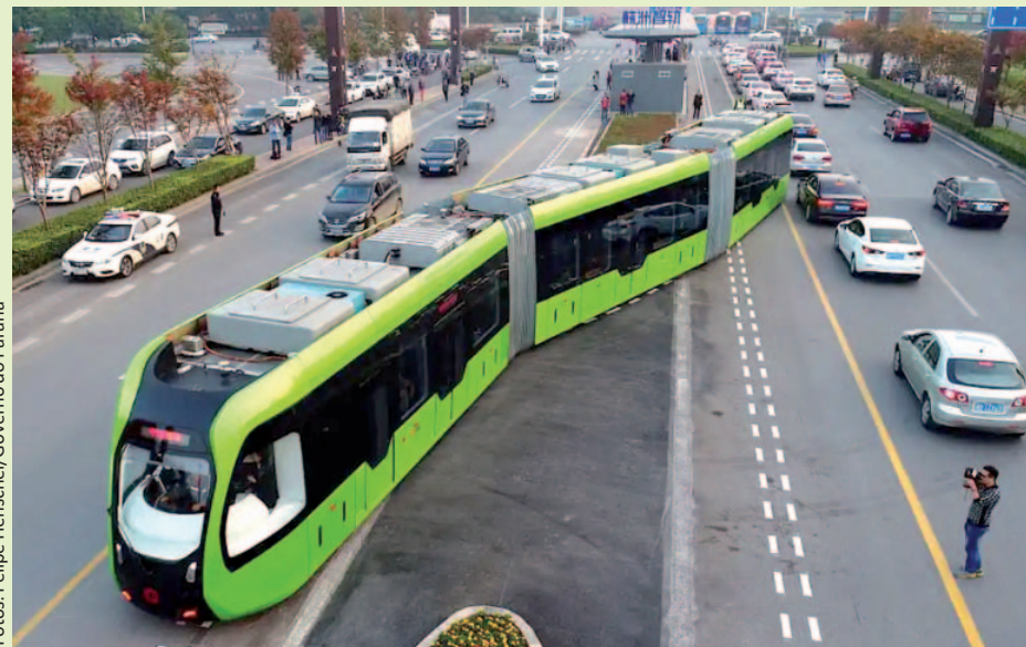
Inédito na América do Sul, o Bonde Urbano Digital inicia operação experimental na RMC, conectando Piraquara e Pinhais em viagens de avaliação técnica

O primeiro veículo do tipo na América do Sul, o Bonde Urbano Digital (BUD) começou a circular em fase experimental nesta semana entre Pinhais e Piraquara, marcando um novo capítulo na mobilidade da Região Metropolitana de Curitiba.