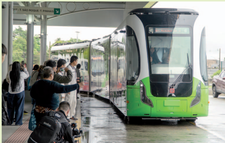
Passageiros registram a estreia do Bonde Urbano Digital, que chamou atenção pela tecnologia utilizada