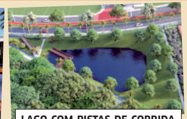
LAGO COM PISTAS DE CORRIDA

Cadastre-se agora mesmo para receber o agendamento de visita, e materiais exclusivos deste pré-lançamento. *Os dez primeiros clientes em Curitiba terão um enorme vantagem em negociação além da valorização garantida.