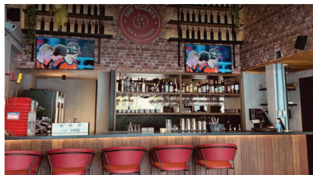
Adega San Vicente

Se você está em busca de um bom vinho acompanhado de pratos incríveis, a Adega San Vicente é a escolha perfeita, com um cardápio variado que inclui receitas autorais e mais de 150 rótulos de vinho à sua disposição.