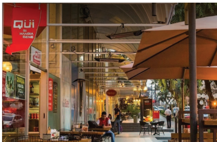
Qui Si Mangia Bene

Complementando essa lista, a Qui Si Mangia Bene é uma moderna forneria napolitana com suas delícias,