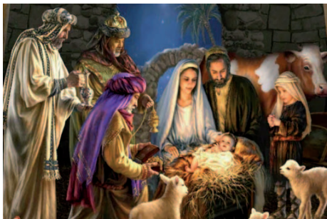
A visita dos Reis Magos a Jesus

Por esse motivo, para os cristãos, trata-se de uma das principais datas comemorativas, ao lado da Páscoa, em que se celebra a ressurreição de Jesus. O dia de Natal é feriado religioso em muitos locais do mundo. O chamado ciclo do Natal é celebrado durante doze dias, que compreendem o dia 25 de dezembro até o dia 6 de janeiro. Esse período está relacionado com o tempo que os três reis magos, Baltazar, Gaspar e Melchior, levaram para chegar à Belém, cidade onde nasceu Jesus.