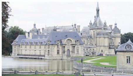
Maison de Chantilly

Em determinada ocasião um conde encarrega Vatel da maior tarefa de sua vida: promover três dias e três noites de festividades no castelo de Chantilly - foram convidados a passar um fim de semana de caça o rei Luís XIV e toda a nobreza totalizando 3.000 pessoas da corte.