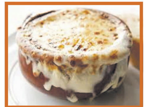
Sopa de Cebola

Fique ligado: em breve novidades no cardápio.