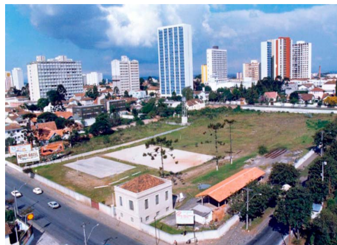
Terreno na Avenida do Batel em 1970