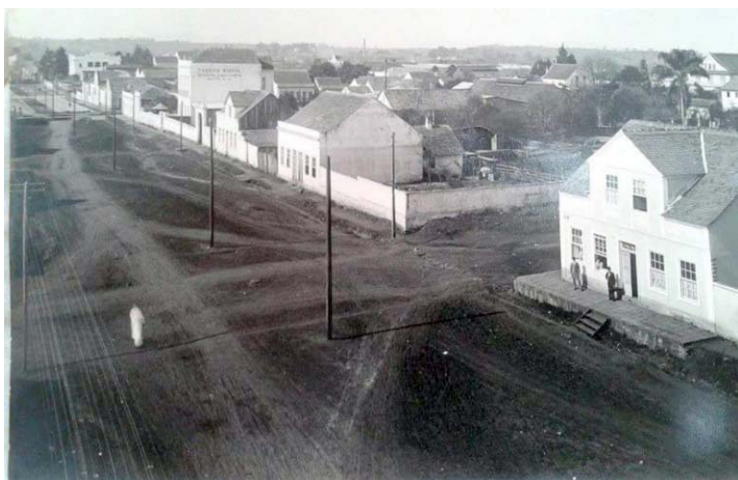
Terreno na Visconde de Guarapuava em 1919

R. Bento Viana, 1200 - Batel, Curitiba - PR, 80240-110 Cultos todos os dias. Cultos Domicais às 09h, 11h e 19h. www.pibcuritiba.org.br @pibcuritiba