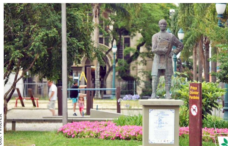
Praça Ouvidor Pardiniho

çu, Sete de Setembro e nas Ruas Petit Carneiro e Brasília Itiberê. No restante do bairro, aos sábados e domingo, imperam